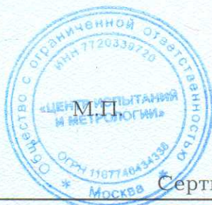
Схема сертификации: Зс.